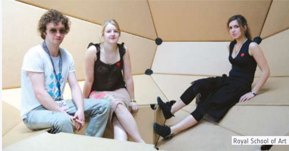
Royal School of Art

Proust's famous questionnaire – with a touch of Design.