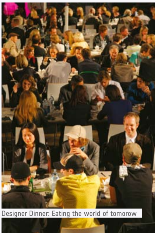
Designer Dinner: Eating the world of tomorrow

darf Berlin auf keinen Fall fehlen. Auch wenn die jungen Designer dafür ein bisschen Mut brauchen, denn eines weiß man über China auch: Mit dem Urheberrecht nimmt man es dort nicht so genau. Noch nicht.